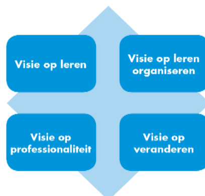
Figuur 1 – Het visiekwadrant

Om ons werken vanuit bovenstaande overtuigingen 'handen en voeten' te geven, hebben we dit uitgewerkt in onze visie , met behulp van onderstaand visiekwadrant.